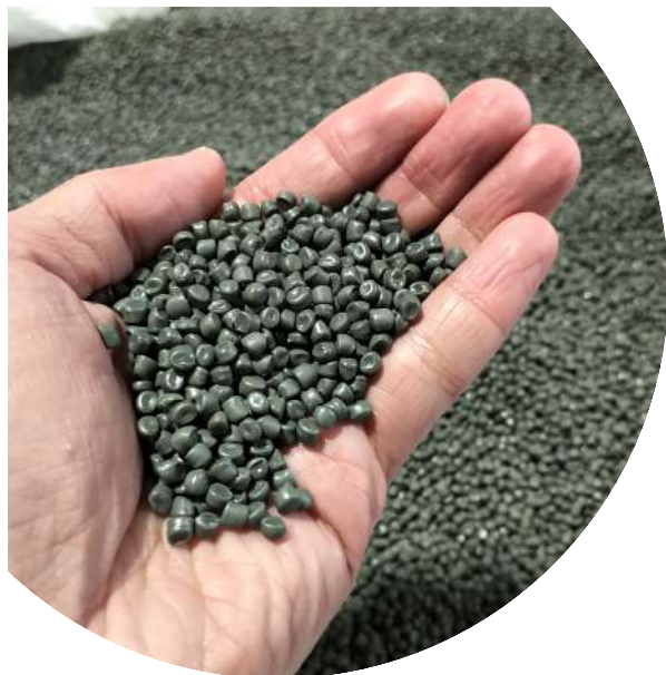
脱臭処理されたペレット