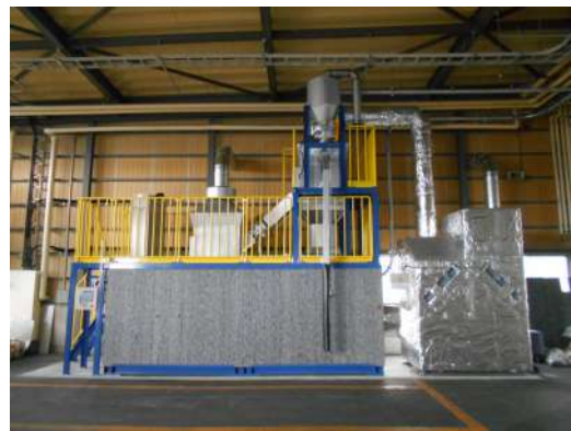
ペレット臭気低減装置