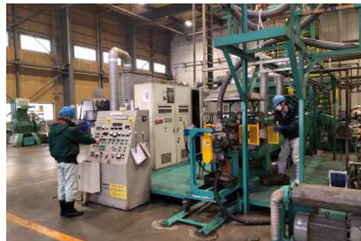
ペレット製造ラインでの作業風景