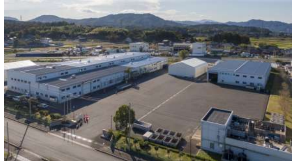
当社のリサイクル工場 鳥取市船木118-1 「いなばエコ・リサイクルセンター」