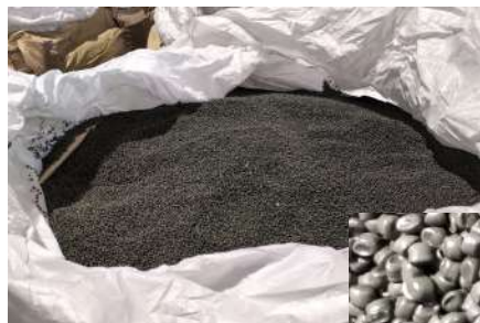
臭気を取り除いたペレットにより、処理量の拡大と評価の安定をはかる