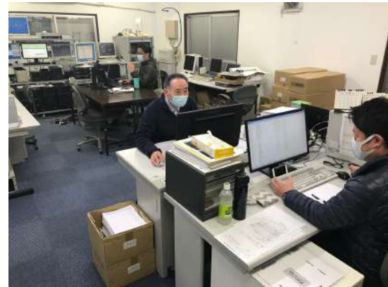
ピッキングデータを処理する電算室風景