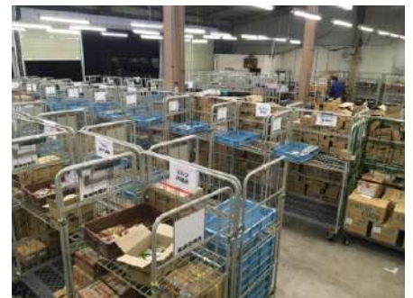
ピッキング作業場