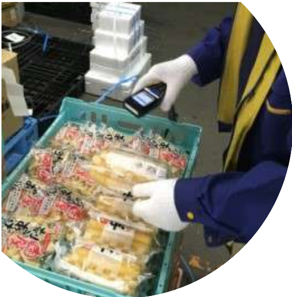
ピッキング作業風景