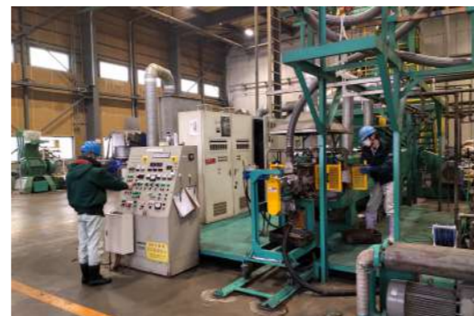
ペレット製造ラインでの作業風景