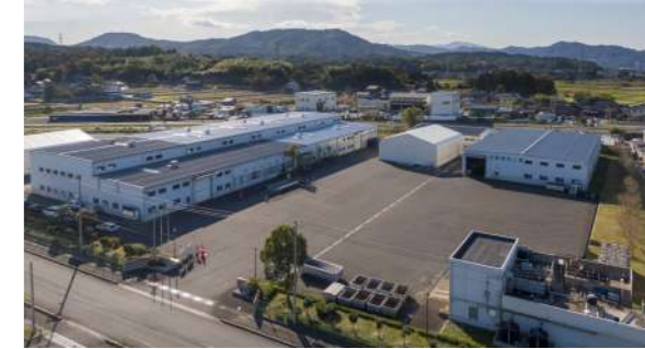
当社のリサイクル工場 鳥取市船木118-1 「いなばエコ・リサイクルセンター」