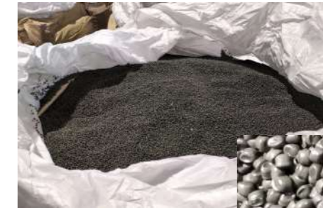
臭気を取り除いたペレットにより、処理量の拡大と評価の安定をはかる